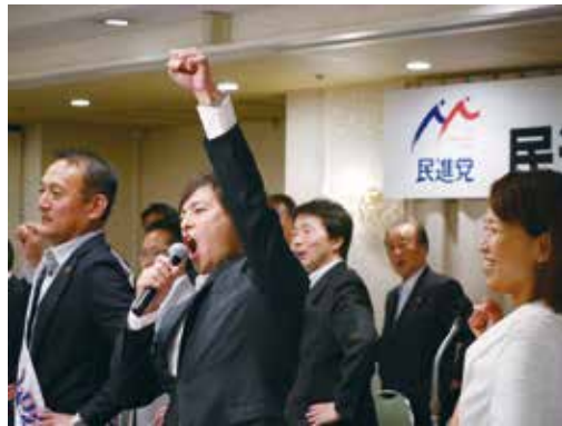
民進党愛知県連青年委員長に就任