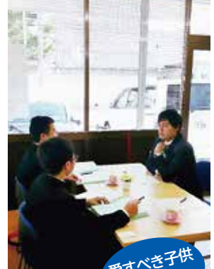
愛すべき子供 たちのために