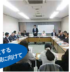
名古屋地協中村区在住者懇談会 中学生社会見学の様子