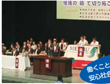
名鉄労組定期大会