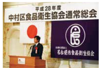
公職者会代表幹事として挨拶