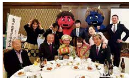
美容あいち中村支部の皆様と