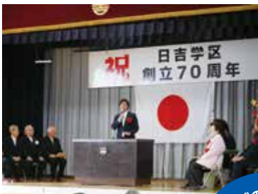
地域の声を 届けます